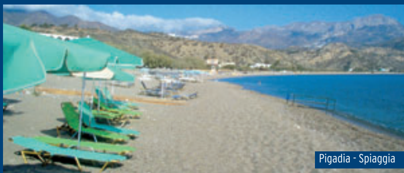
Pigadia - Spiaggia