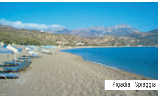
Pigadia - Spiaggia