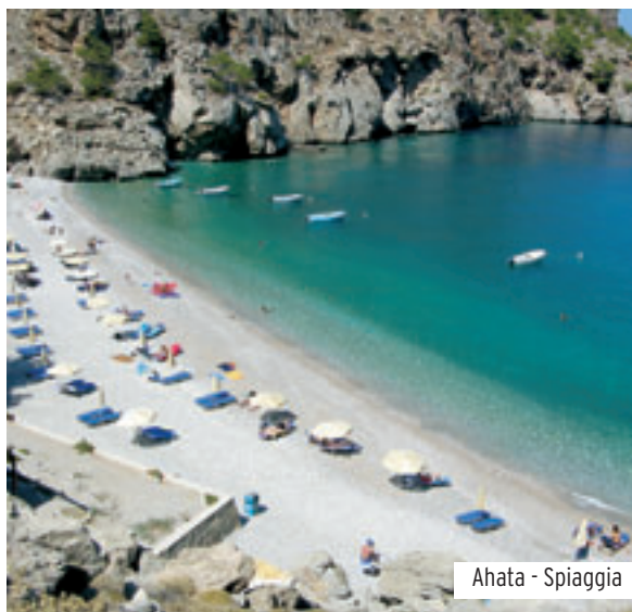
Ahata - Spiaggia

IL NOSTRO GIUDIZIO: hotel originale, con un'attenta gestione familiare, luogo indicato per chiunque desideri per qualche giorno estraniarsi dal mondo.